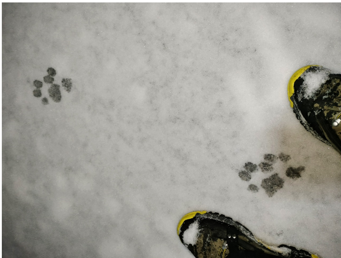
Orme di lupo in Valle Pesio

Escursionismo primaverile. È piena notte, lascio la macchina in una delle frazioni della valle Pesio e inizio a salire, senza fretta, verso una borgata abbandonata. Una volta oltrepassata scorgo, nel buio tra gli alberi a monte, qualcuno che mi sta osservando: sorrido perchè, quel riflesso blu vitreo degli occhi, l'ho già visto altre volte. Poco più su ecco l'incontro, a pochi metri di distanza. Con riverenza, evito di puntare la frontale, tantomeno sfodero la macchina fotografica con flash ultrasonico; mi limito a osservarli, così come loro stanno facendo con me. Proseguo il cammino che, poco dopo, viene premiato: sul mio percorso le loro orme. Le seguo per un tratto, fino a che esse non virano verso valle, mentre io continuo la salita verso la cresta, grato di questo meraviglioso incontro. In un domani nemmeno troppo lontano, ne verrà meno la tutela e sarà dato il via libera alla caccia. Viceversa, il lupo non cacerà mai gli esseri umani.